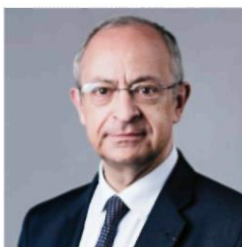
Frederic BAVEREZ Az ATALIAN Cégcsoport Elnöke

A Magatartási Kódex referencia minden ATALIAN alkalmazott és érdekelt fél számára. Elérhető a vállalat weboldalain és belső hálózatán, lefekteti a Cégcsoport értékeit, magatartási szabályait és tevékenységét. Ezek az értékek képezik a gazdasági, társadalmi és környezeti teljesítményünk alapját. Számunkra alapvető fontosságú a példamutatás és a feddhetetlenség a megfelelőség szempontjából, alapvető, ha biztosítani akarjuk az üzletünk fenntartható növekedését, nevezetesen garanciák nyújtásával ügyfeleink részére, és a tehetségek bevonásával, továbbá megtartásával. Ebben az értelemben a feddhetetlenségünk egyértelműen versenyképességi tényező.